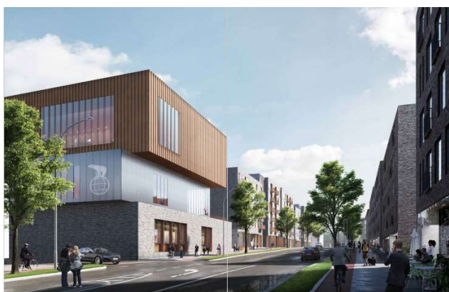
Storcenter og biograf set fra Finlandsgade

På gårdsiden etableres et fælles opholdsareal, som en taghave ovenpå centret. Her etableres der små forhaver til de nederste boliger og altaner til de øvre boliger. Fra biografen er der ligeledes mulighed for at gå ud på opholdsarealet. Parkering løses ved at etablere yderligere p-pladser i den eksisterende parkeringskælder, så der samlet er ca. 1.000 p-pladser i centeret.