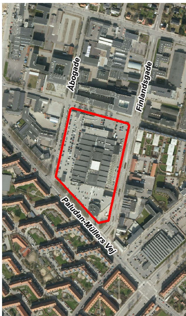
Området set fra luften.

Denne høring er et oplæg til debat om at udvide Storcenter Nord med butikker, biograf og boliger. Den private grundejer har anmodet Aarhus Kommune om, at ændre planlægningen for området, så det er muligt at opføre bebyggelse i op til 6 etager med en bebyggelsesprocent på 165. Hvis Aarhus Kommune skal imødekomme dette, skal kommuneplanen ændres, og der skal udarbejdes en lokalplan.