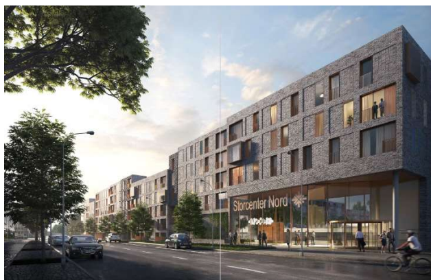
Storcenteret med opgraderet indgang set fra Helsingforsgade

På taget etableres en ny biograf med 6 sale med plads til ca. 630 gæster. Biografen bliver med store 2-etagers vinduer, der både giver de besøgende en fremragende udsigt over Aarhus og samtidig åbner biografen op, så