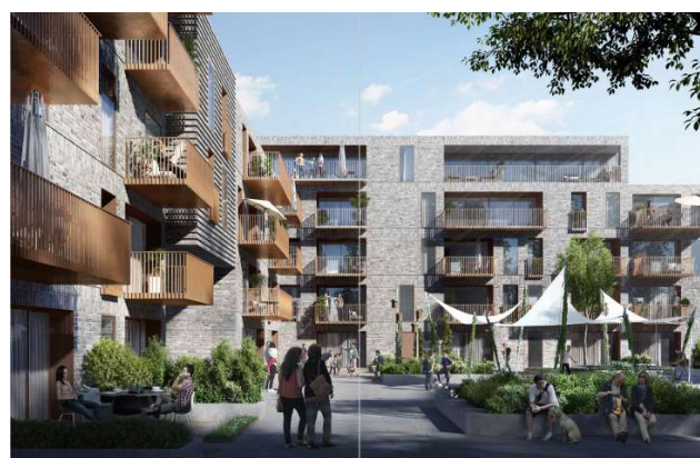
Visualisering af taghaven på storcenterets tag